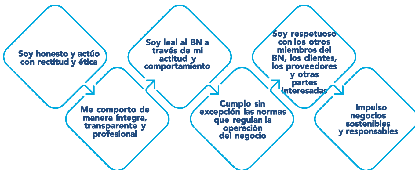
Figura 2: Principios corporativos del CFBNCR